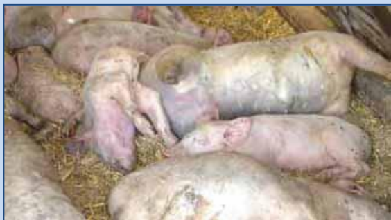
Cyanóza uší a distálních částí končetin

Klinické příznaky: horečka >41,5^{\circ}\text{C} , shlukování, cyanóza, mortalita >30\%